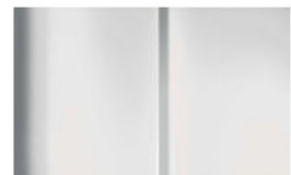
Réf. : COLOR_WPP0