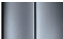
Réf. : COLOR_ZRMO