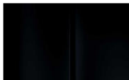
Réf. : COLOR_XYP0