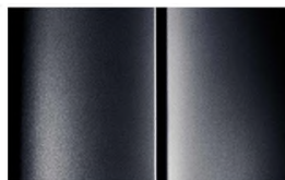
COLOR_XYMO Image 13 of 13