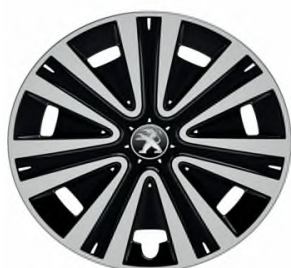
Enjoliveur NATEO 15"