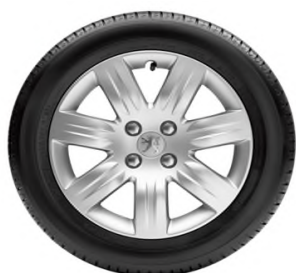
Enjoliveur GRENADE 16"