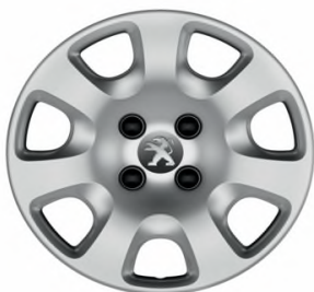
Enjoliveur ATACAMA 15"