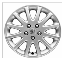
Jantes Alliage Vivace 16"