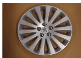
Enjoliveurs Full Cover