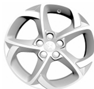
Jantes alliage 17" Style 09