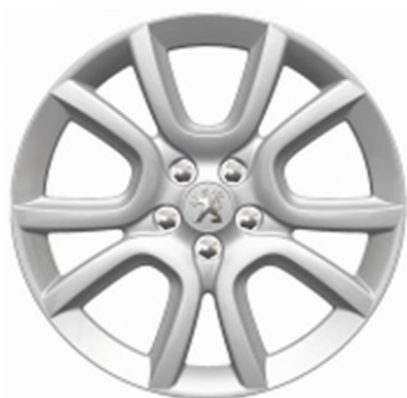
Jantes alliage 18" Style 07 Non chaînable