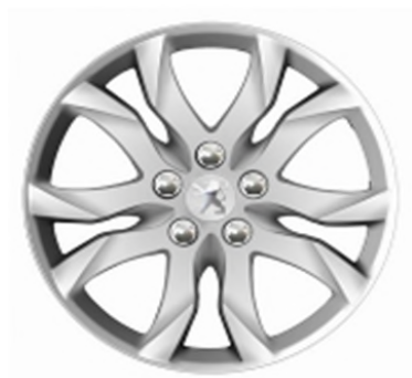
Jantes alliage 17" Style 05