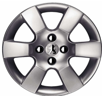
Jante alliage 16" ERIS

Toutes les jantes de 5008 sont chaînables avec jeux réduits.