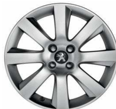
Jante alliage 18" IXION