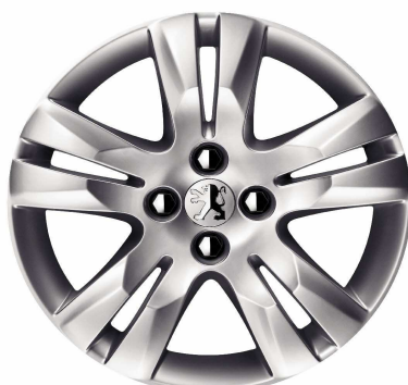
Jante alliage 17" QUARK