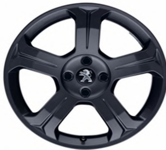
Jante alliage Licancabur 18" Dark Storm