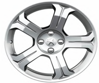
Jante alliage Licancabur 18"