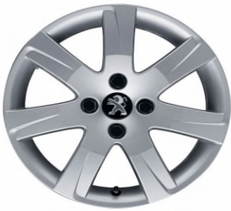
Jante alliage Santiagoito 2. 16"