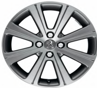
Jante alliage Melbourne 17"